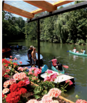
Kanutour auf der Tauber

Nachstehende Verleihstationen stehen Kanu- und Kajakbegeisterten zur Verfügung. Wichtigste Voraussetzung ist ein ausreichender Wasserstand der Tauber. Hier kommt es allenfalls im Hochsommer einmal zu kleineren Engpässen. Bitte nehmen Sie auf die Natur und die zahlreichen Wasser- und Uferbewohner Rücksicht und beachten auf jeden Fall die Sicherheitshinweise der Verleiher.