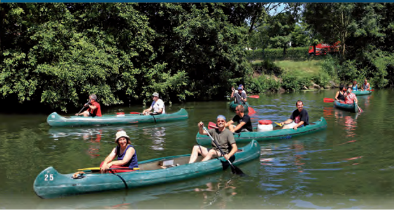
Naturerlebnis auf der Tauber

Kanu Kajak Rudern Angeln Schiffahrt Badeseen Schwimmbäder